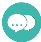
Table ronde : Présentation de situations complexes vécues par différents acteurs sur un territoire : quels enseignements en tirer et quels impacts sur les pratiques ?