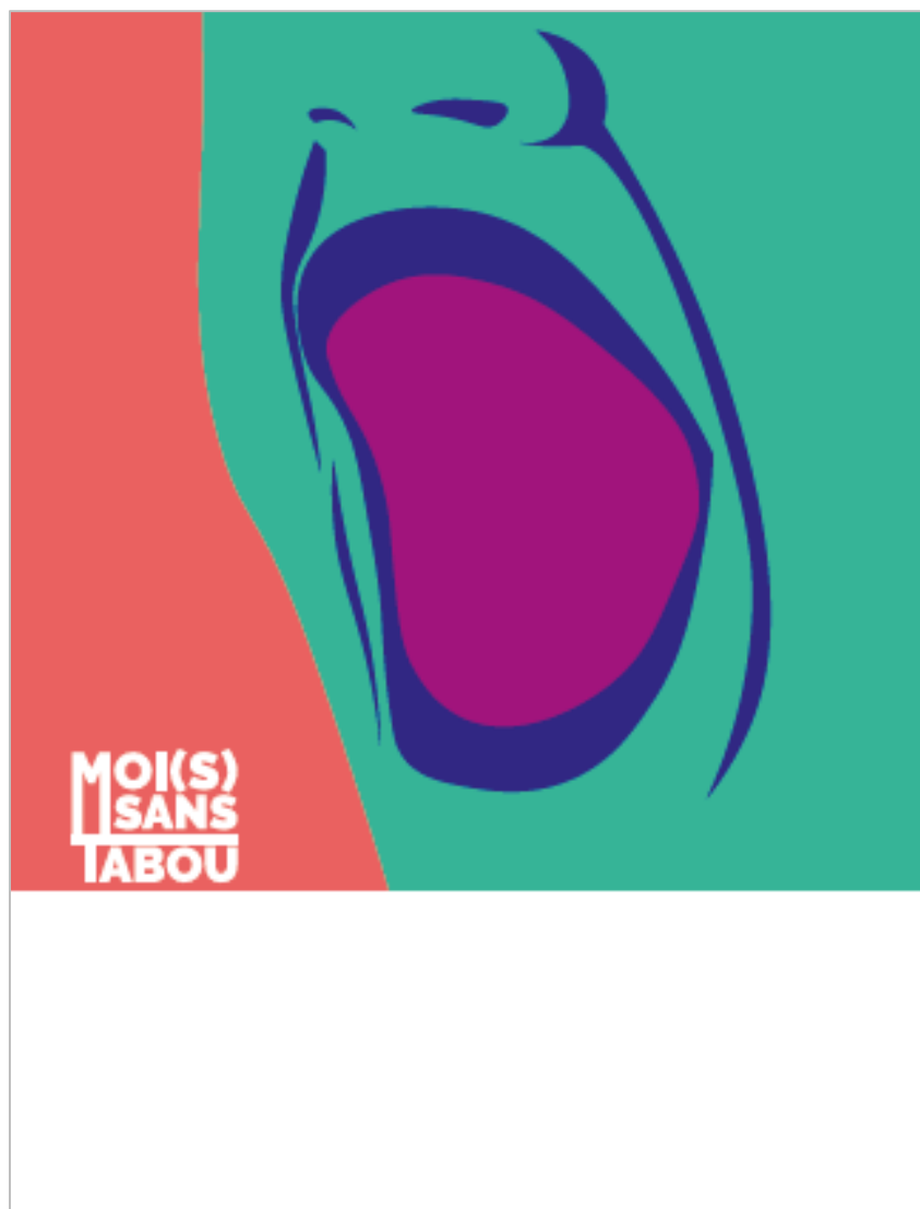
HAUT ET FORT _ PERSONNALISABLE_ Visuel 1_ A3