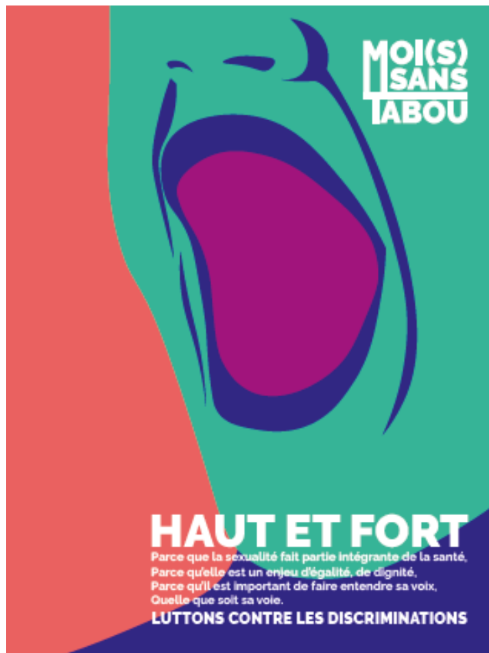
HAUT ET FORT _ Visuel 1_ AFFICHE FORMAT A3