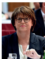
Martine Aubry Maire de Lille

Nous vous encourageons à venir les découvrir et vous souhaitons des moments de partages, de réflexions et de joies tout au long de ce Printemps !